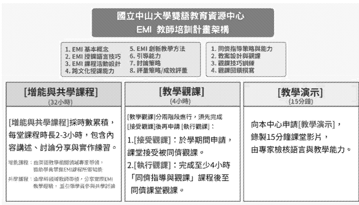
圖一、國立中山大學雙語教育資源中心 EMI 教師計畫架構